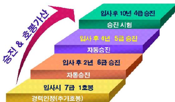
<승진 및 호봉가산 제도>