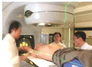
4대암 평가 1등급 암센터