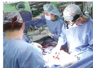
풍부한 실적과 좋은 치료결과 심장수술(OPEN HEART)