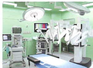
최첨단 4세대 로봇 '다빈치' 도입 로봇수술센터